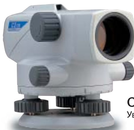
С300 Увеличение 28x

Предлагайки Ви най-доброто от Sokkia технологията за нивелири, С300, С310, С320 и С330 автоматичните нивелири са компактни, солидни, бързи и много лесни за ползване. Установяването на станция, хоризонтирането и визирането е детска игра. Нещо повече, С3 гарантират изключителна издръжливост на тежки външни условия. Освен, че са имунизирани срещу вибрации и удар, моделите С3 са напълно устойчиви на продължителни валежи и на инцидентно силно намокряне. Вие не бива да се притеснявате от намокряне на уреда - просто се концентрирайте върху Вашата работа. Благодарение на солидния корпус, С3 нивелири се ползват и вътре, и вън, при тежки изкопни и канализационни работи. Всички С3 модели посрещат JIS grade 4 спецификация за водоустойчивост, което означава Electrotechnical Commission Standard, Class IPX4.