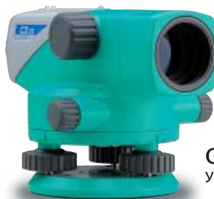
С320 Увеличение 24x