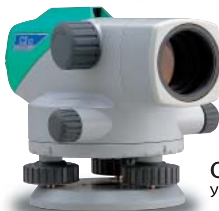
С310 Увеличение 26x