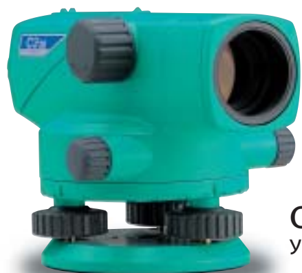
С330 Увеличение 22x